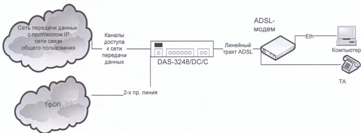
Схема подключения к сети общего пользования, с обозначением реализуемых интерфейсов:

Емкость коммутационного поля – не выполняет функций коммутации.