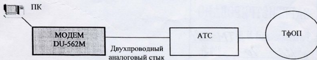
Схема подключения к сети связи общего пользования Российской Федерации

Емкость коммутационного поля – не выполняет функций коммутации.