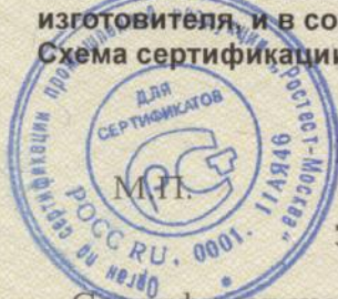
Схема сертификации - 3.

Место нанесения знака соответствия - на продукции и упаковке, рядом с товарным знаком изготовителя, и в сопроводительной документации. Форма и размеры знака по ГОСТ Р 50460-92.