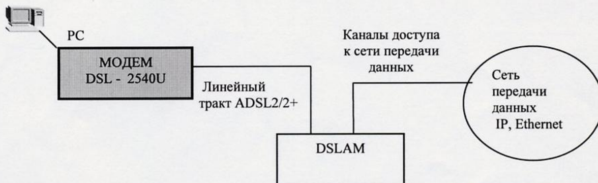
Схема подключения к сети связи общего пользования Российской Федерации

Емкость коммутационного поля – не выполняет функций коммутации.