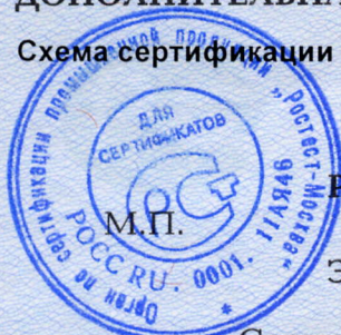
Схема сертификации – 3.