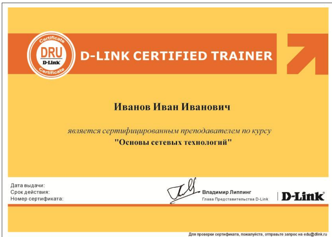
Рис. 1. Сертификат D-Link Certified Trainer