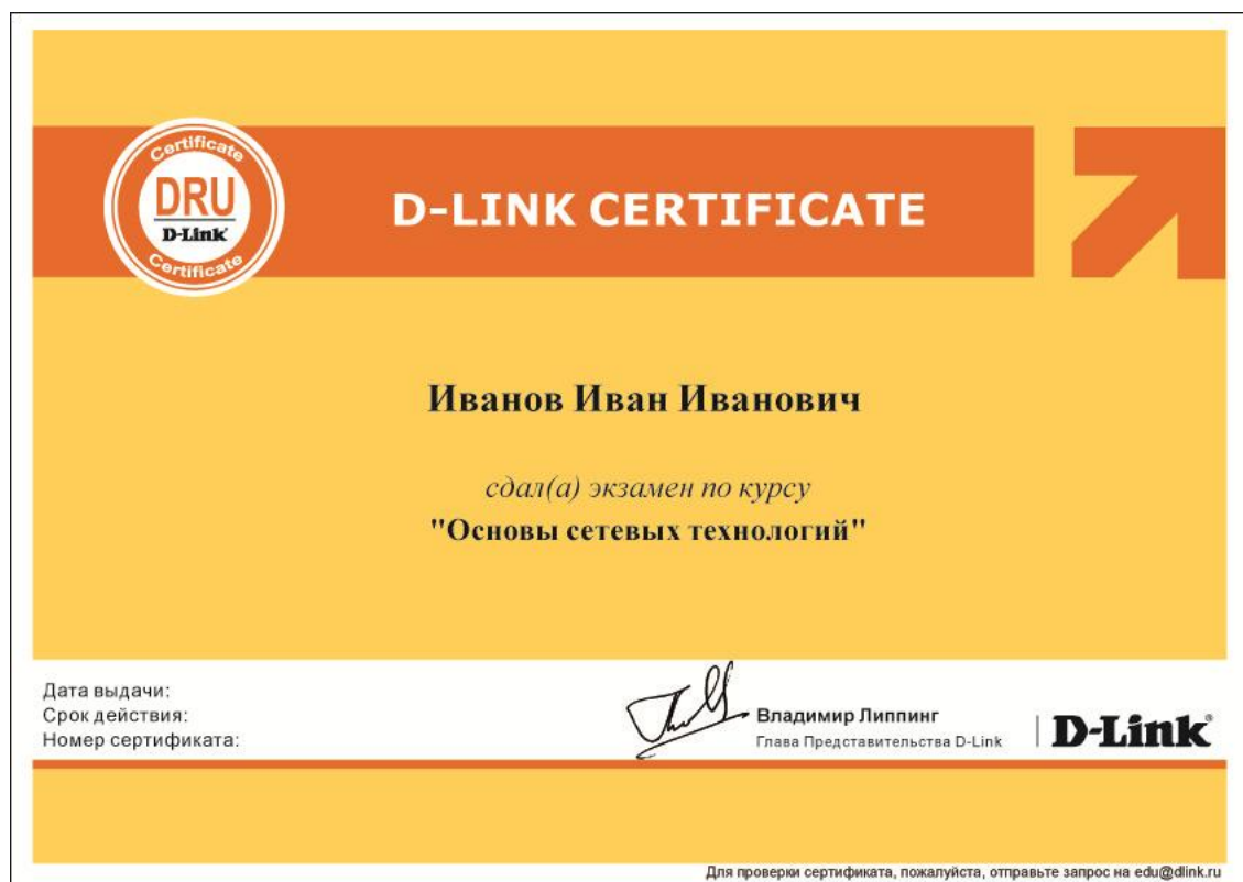
Рис. 2. Сертификат D-Link